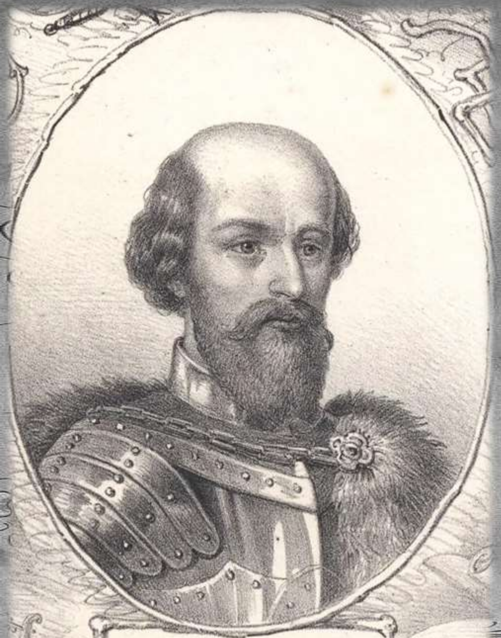
Matouš Trenčanský † 1320.

Podobizeň Matúša Čáka sa nezachovala. Takto si ho predstavoval maliar, ktorý žil v 19. storočí.