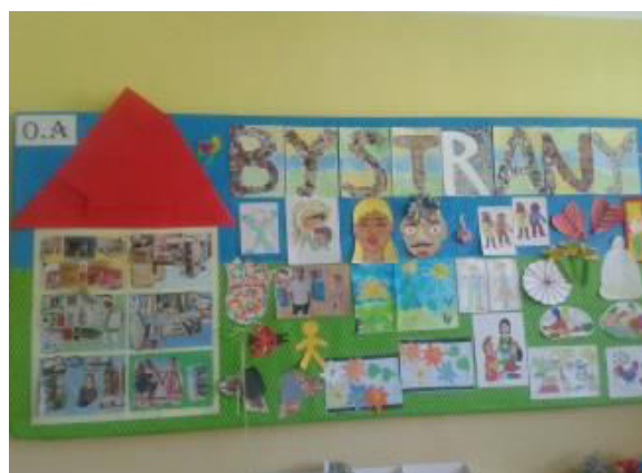
O.A, O.B, O.C, I.A, I.C, I.D