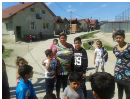
0. A, 0. B, 0. C